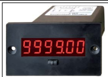
Рисунок 1. Счётчики моточасов СМ-1-ВК. Вариант с чёрной панелью. Общий вид