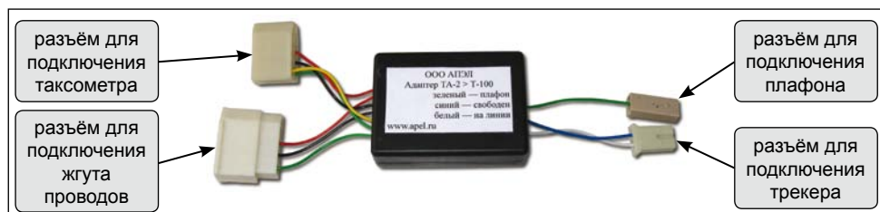
Рисунок 1. Адаптер связи «Таксотрек». Общий вид.

щие дискретные сигналы на входы трекера, а также автоматически включает и выключает плафон такси.